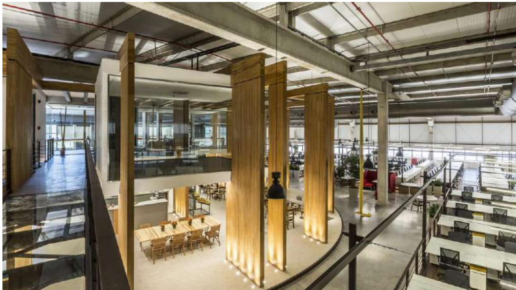
Foto 9 Mezanino localizado acima do Coffice com salas de brainstorm. O acesso pode ser pela escada ou por meio da passarela que o liga a outros mezaninos.