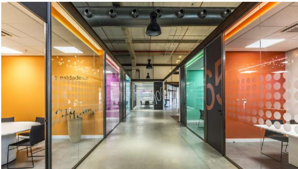
Foto 4 Salas de reunião.