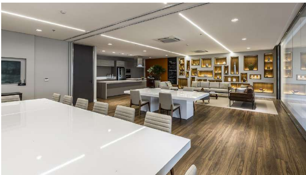
Foto 13 As salas no mezanino podem ser unificadas ou separadas por divisórias retráteis.