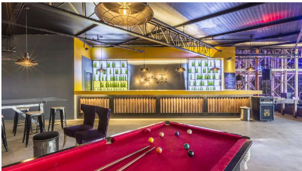
Foto 14 Espaço para confraternização com palco para apresentações, instrumentos musicais, bar e mesas de jogos.

Com capacidade para 200 pessoas, o Complexo Intensidade possui também o Espaço Rock, uma área dedicada para confraternizações e happy hour, equipada com mesa de bilhar, palco para apresentações, instrumentos musicais e bar. Um ambiente que combina cores vibrantes e decoração bastante temática no melhor estilo Rock'n Roll.