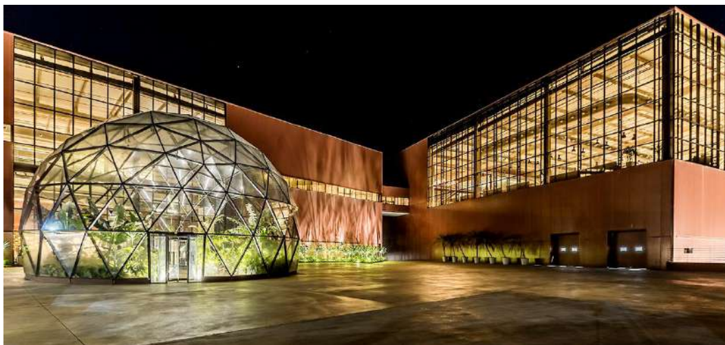
Foto 1 Estrufa localizada logo na entrada do complexo contextualiza os visitantes antes mesmo de entrarem no prédio.

A história da Cacau Show é muito valorizada internamente. Na recepção, ao lado da porta de entrada, há um breve relato da trajetória de Alexandre e do surgimento da companhia, acompanhado do simbólico Fusca responsável por sua locomoção na fase inicial da carreira. É nesta área também que todos os franqueados são homenageados. Ocupando quase uma parede inteira, há um painel de madeira todo vazado. As mais de duas mil peças que já preenchem alguns dos espaços contêm o nome do franqueado e a localização de sua loja.