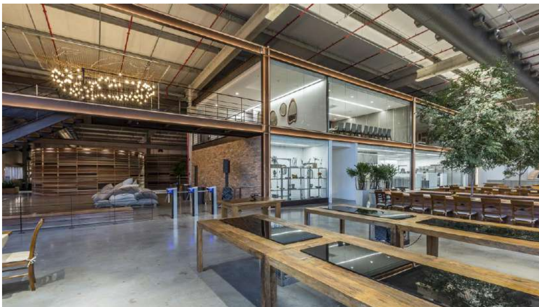
Foto 12 Mezanino acima da cozinha do refeitório com lounge, salas de reunião e cozinha gourmet.

divisão dos espaços torna o pavimento bastante versátil, permitindo a realização de almoços formais em um único e amplo ambiente.