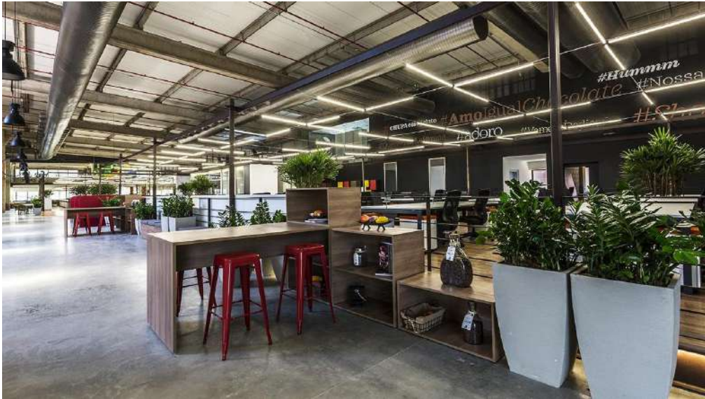
Foto 3 Área de apoio ao lado das estações de trabalho.