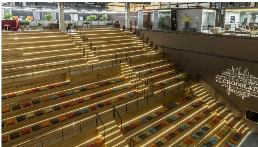
Foto 8 Arquibancada com 500 lugares e tecnologia audiovisual.

O outro espaço de destaque no andar é a arquibancada. Uma estrutura de madeira com 500 lugares, palco e tecnologia audiovisual, idealizada para realizar comunicados aos colaboradores e eventos internos e externos. Ao fundo do palco há uma parede de vidro, que dá vista à megastore a qual pode ser acessada pelo tobogã instalado ao canto. O objetivo da transparência entre o escritório e a loja é o de dar maior visibilidade à “Razão de Existir” da companhia: o cliente.