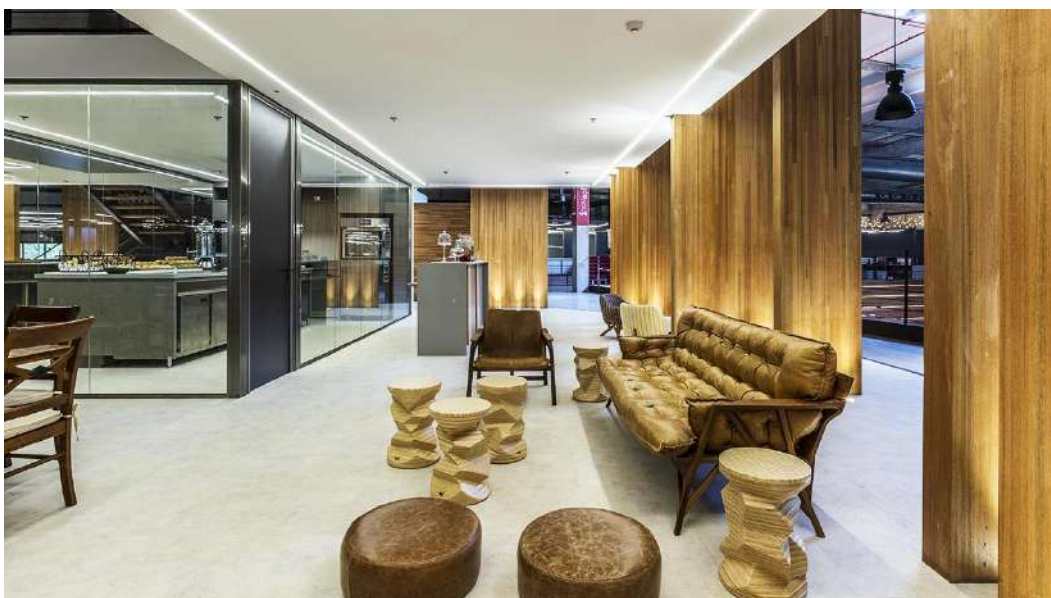
Foto 7 Área do Coffice com cozinha para desconpressão, reuniões informais, trabalhos colaborativos e pausas para o café.

Além do Coffice, outras opções para descontração ficam por conta das áreas com bancos e poltronas que, além de harmonizar com todo o espaço, são uma opção de relaxamento para os colaboradores ao longo do dia.