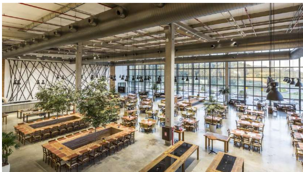
Foto 11 Refeitório com cozinha industrial e forno de pedra.

Com características bastante rústicas e em um ambiente convidativo ao relaxamento, o refeitório comporta 420 pessoas ao mesmo tempo, distribuídas entre mesas com diferentes propostas: maiores, menores, redondas, retangulares e grandes mesões vazados ao centro.